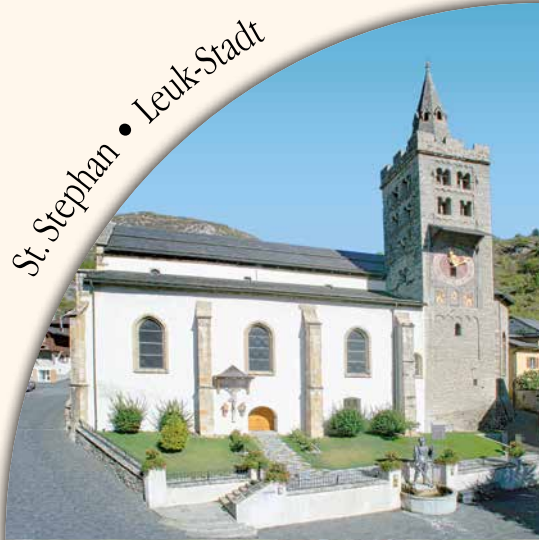
St. Stephan • Leuk-Stadt