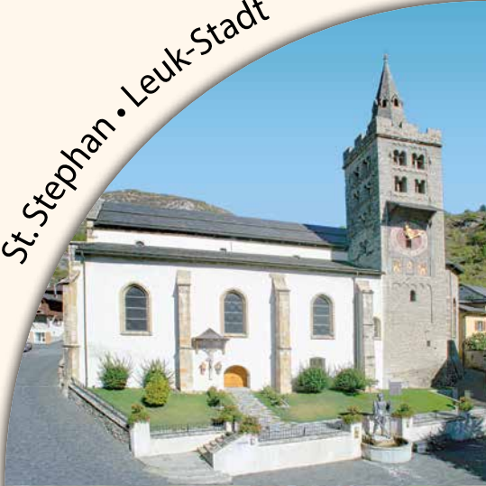
St. Stephan • Leuk-Stadt