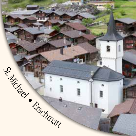
St. Michael • Erschmatt