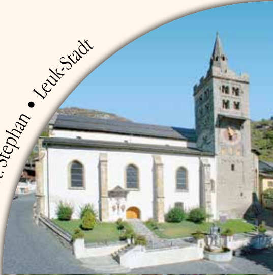
St. Stephan • Leuk-Stadt