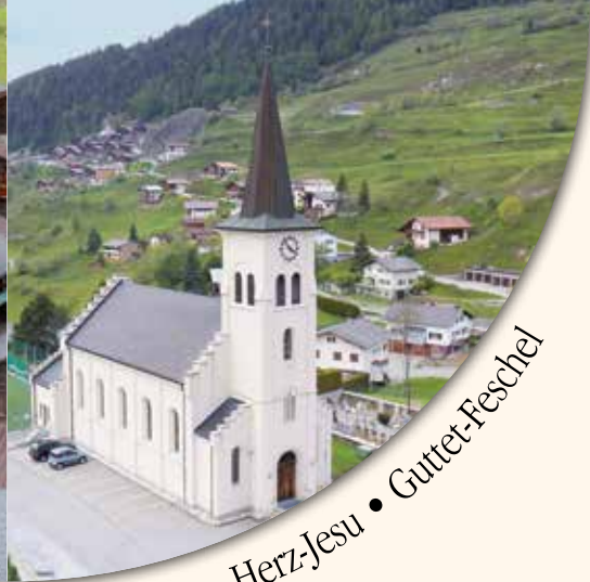
Herz-Jesu • Guttet-Feschel