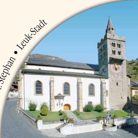
St. Stephan • Leuk-Stadt