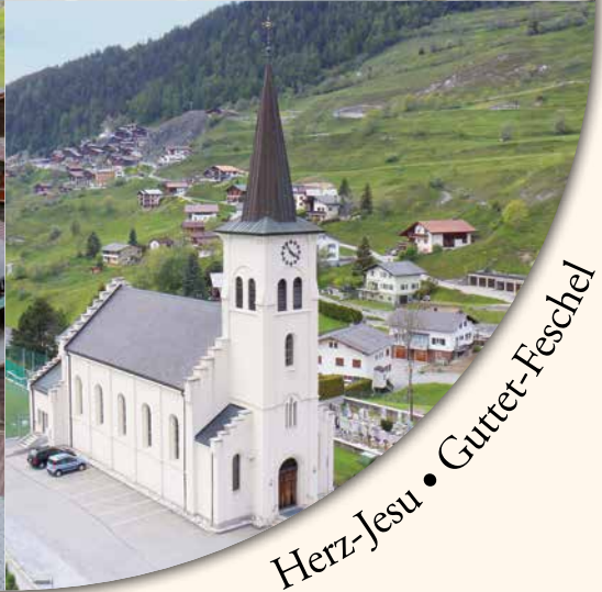
Herz-Jesu • Guttet-Feschel