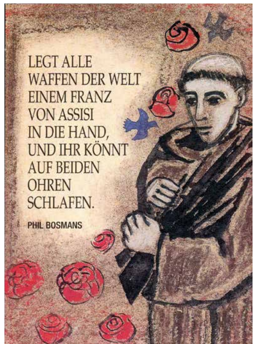
Kunstverlag Maria Laach, No 1920