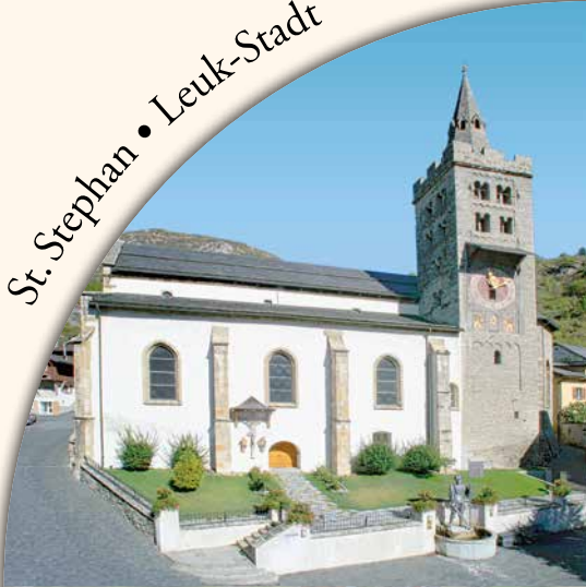
St. Stephan • Leuk-Stadt